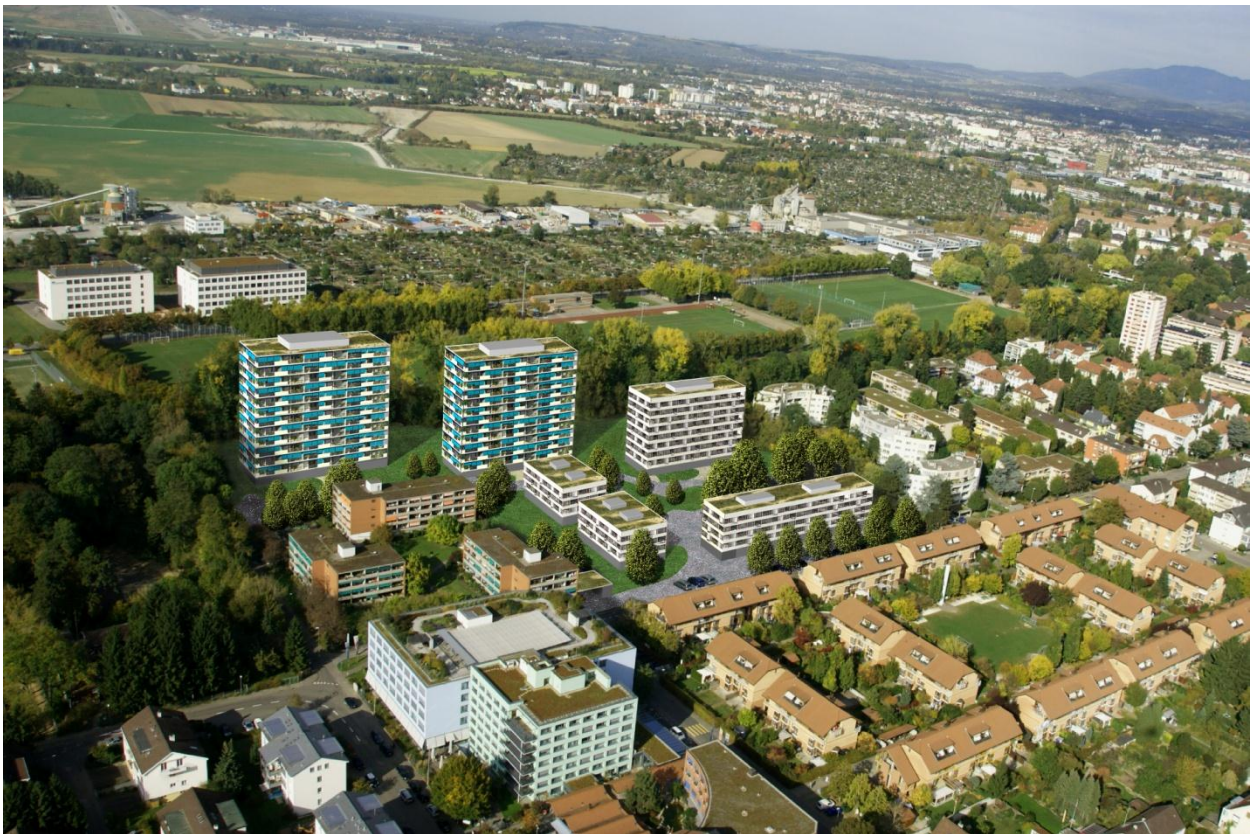
Flugaufnahme Süd (Baselmattweg)