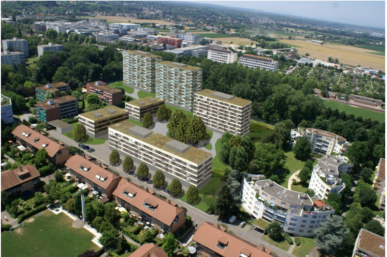
Flugaufnahme Ost (Baselmattweg)