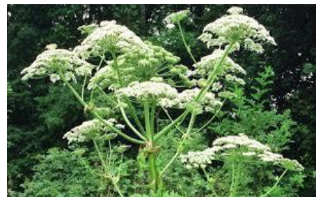
Berce du caucase Riesenbärenklau

Les plantes invasives ont un impact environnemental, sanitaire et économique importants. Il est nécessaire de limiter leur développement par l'arrachage systématique de ces plantes (par exemple arracher et mettre aux ordures ménagères)