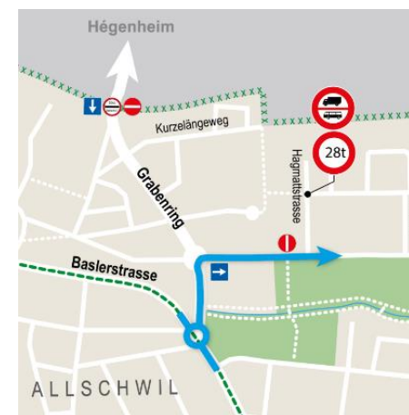
Abb. 1: Zufahrt Bachgraben u.a. ab Grabenring