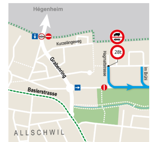
Abb. 2: Wegfahrt Bachgraben nur in Richtung Basel