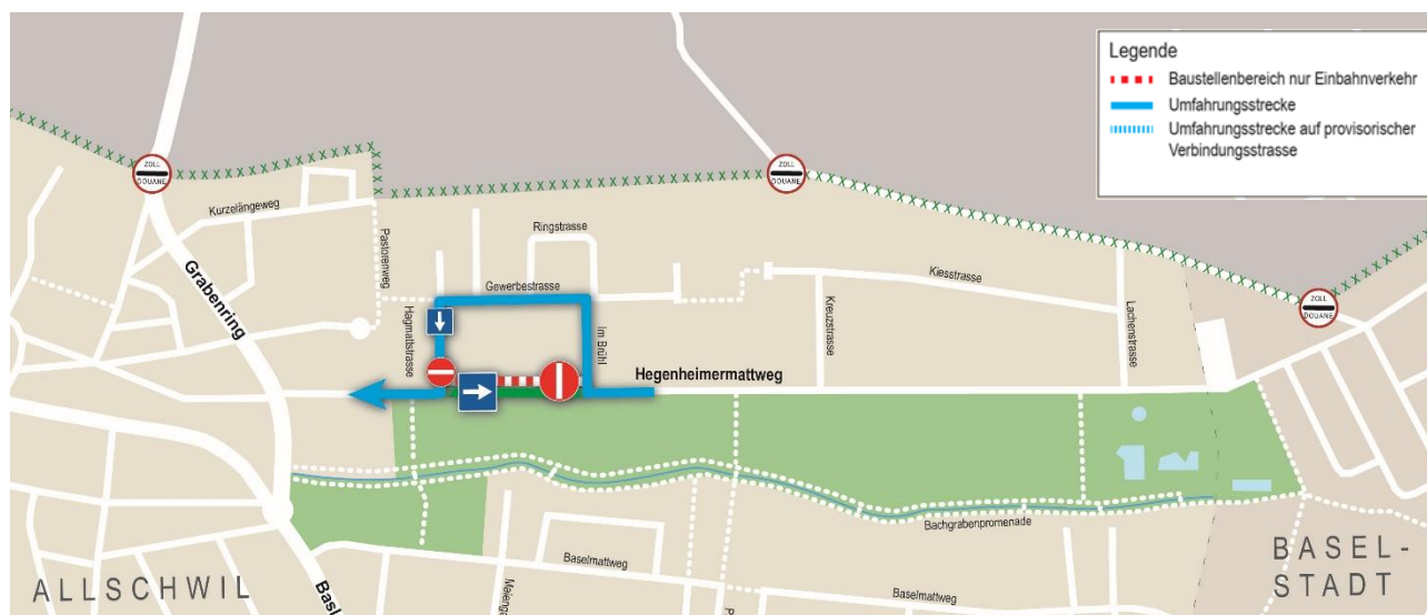
Grafik 3: Verkehrsführung im Bauabschnitt 2.3: ab Di., 14. Juli 2020 bis Ende September 2020