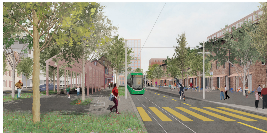
Die Binningerstrasse erhält in den nächsten Jahren ein neues Gesicht – und eine neue Tramlinie. Visualisierung: pool Architekten.

https://www.allschwil.ch/de/aktuelles/Masterplan-Entwicklungsschwerpunkt-Binningerstrasse/Dossier.php