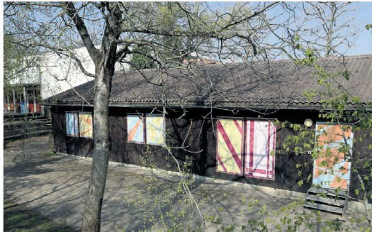
Im in die Jahre gekommenen Holzpavillon hat so manche Party stattgefunden, so zum Beispiel die traditionelle Grufti-Disco.