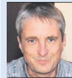
Von Andi Signer

Ein frischer Frühlingmorgen erwacht, ich unternehme mit meiner Besten einen ausgedehnten Waldspaziergang. An den noch kahlen Bäumen spriessen die jungen Knospen, die Büsche stehen bereits voll in der Blüte. Die Vögel singen in den Bäumen um die Wette, Natur pur.